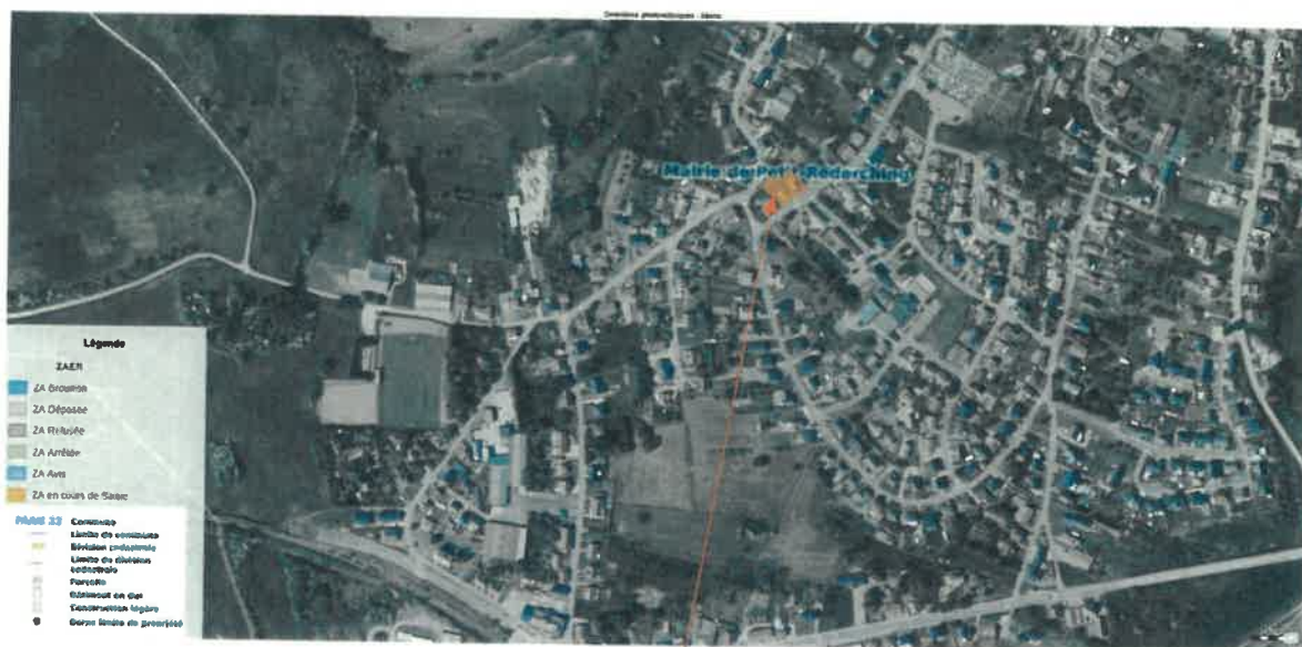
Ombrières parking mairie