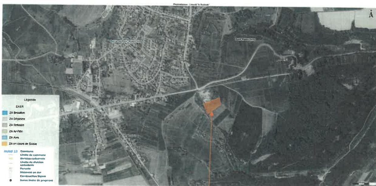
Photovoltaïque au sol « La Redoute »