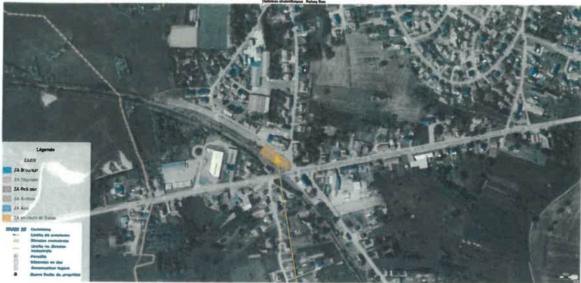
Ombrières parking de la gare