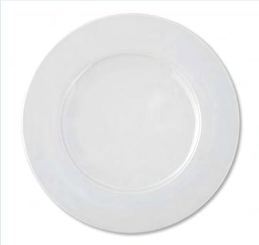
150 assiettes de présentation