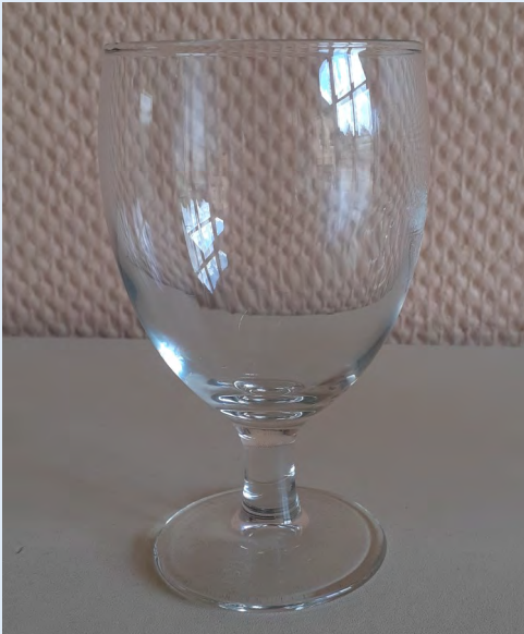
170 verres à vin