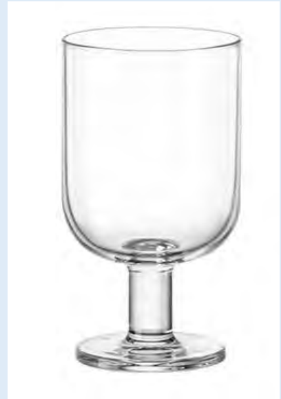
160 verres à vin Hosteria