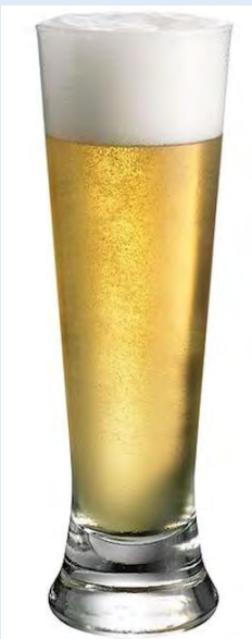
45 verres à bière Martigues