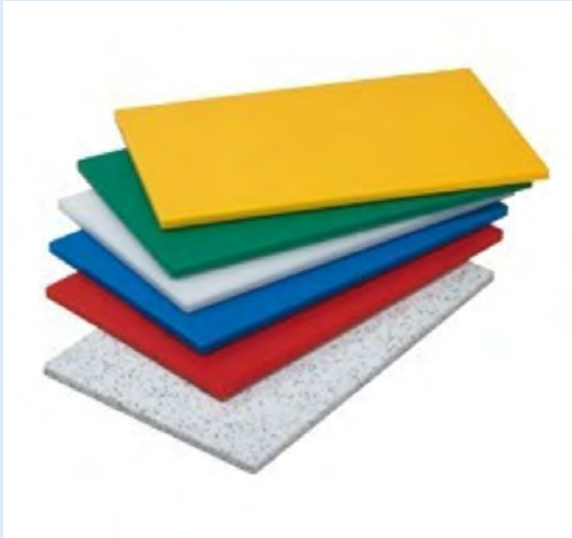
3 planches à découper