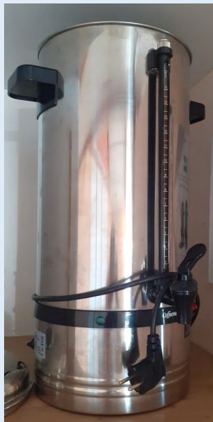
2 percolateurs 15 litres