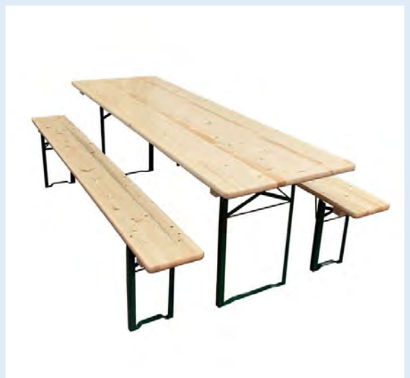
15 garnitures de brasserie