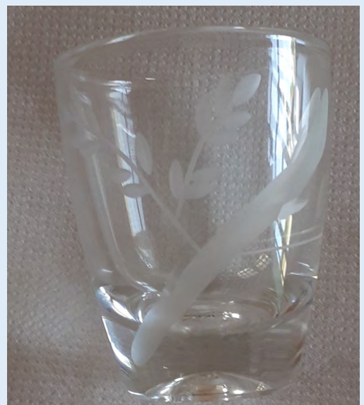
65 verres à eau de vie