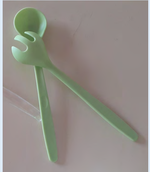
7 couverts à salade