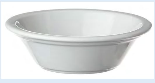
215 coupelles à dessert