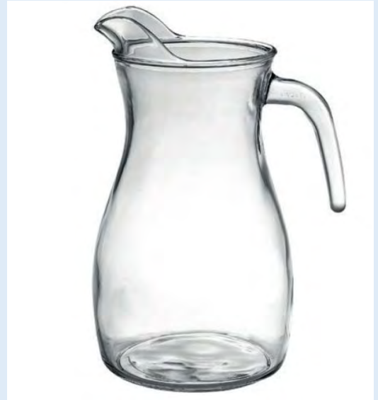
5 brocs 1,5 litre Venezia