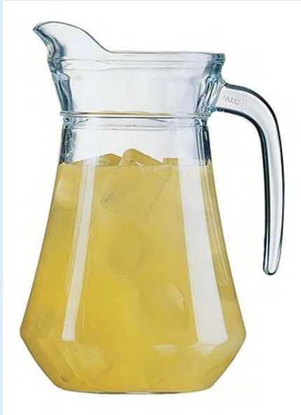
11 brocs 1 litre Arc