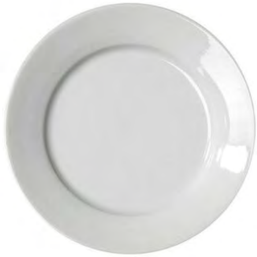
225 assiettes à fromage Gala