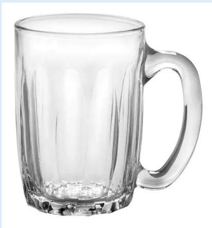
45 tasses à thé Orléans