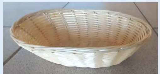
36 paniers à pain (différents modèles)