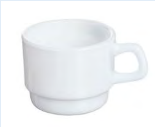
410 tasses à café