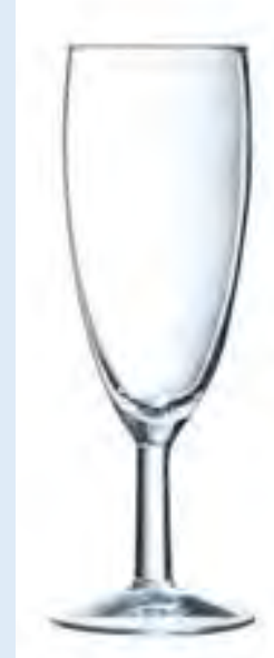
100 flûtes Savoie