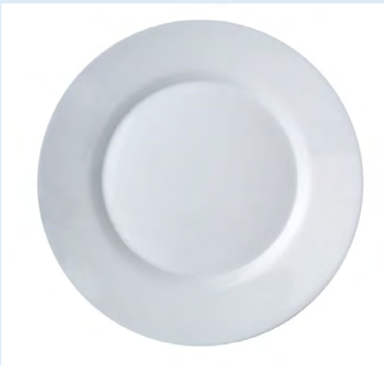
25 assiettes à dessert Toledo