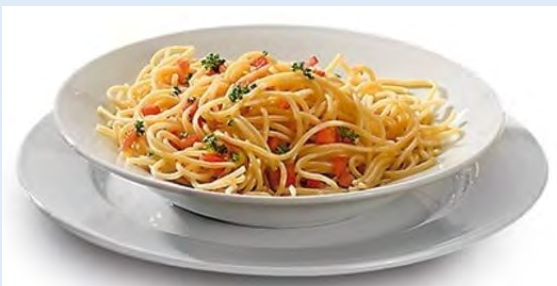
530 assiettes creuses Gala