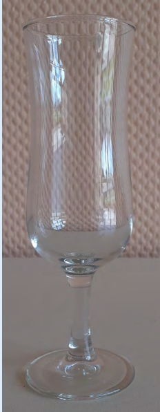
60 flûtes Normandie