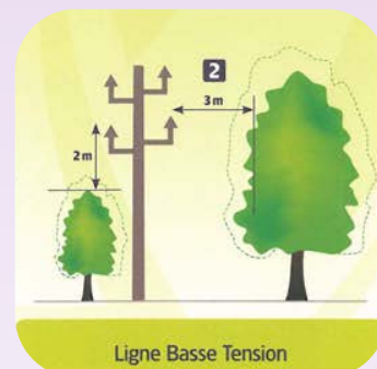
Ligne Basse Tension

Centre Appel Dépannage le + info ERDF 09 726 750 57